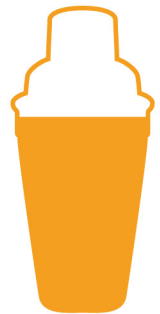
Une rivière de graphisme

“ Composons ensemble le cocktail qui vous ressemble ! ”