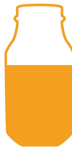
Une mesure d'affiliation