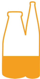
Un zeste de re-targeting