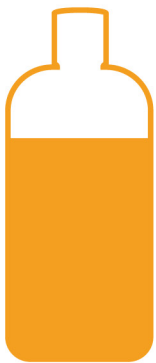
Une rasade de SEM

2 Nous réalisons le mix e-marketing le plus adapté à votre problématique et visant à affecter de manière optimisée l'ensemble des leviers web à votre disposition. Une fois ce mix validé, nos experts métiers le mettent en oeuvre.